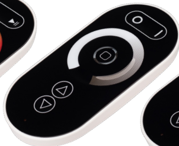
ARL-1022-SIRIUS-DIM Арт. 027146