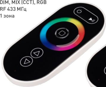
ARL-1022-SIRIUS-RGB Арт. 023170