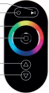
Рисунок 1. Внешний вид пульта дистанционного управления и назначение органов управления.