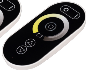
ARL-1022-SIRIUS-MIX Арт. 027147